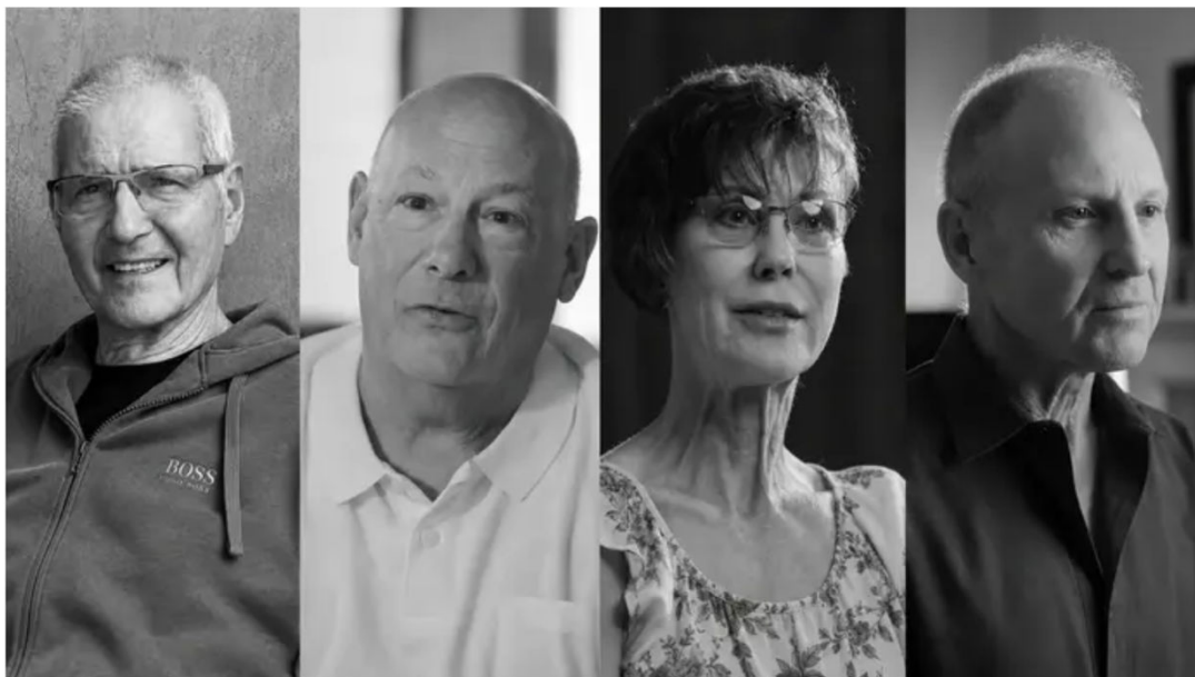
בלי תסמינים, בלי סימני אזהרה, עם גילוי ששינה הכול / צילום מקור: גרייל | עיבוד בינה מלאכותית

בדיקת "גלרי" היא בדיקת דם חדשנית המאפשרת לזהות סימנים לעשרות סוגי סרטן, לעיתים עוד לפני הופעת תסמינים. אלפים כבר עברו את הבדיקה בישראל ובעולם, וחלקם גילו בזכותה ממצאים בשלב מוקדם שאפשר טיפול מהיר והגדיל משמעותית את סיכויי ההחלמה